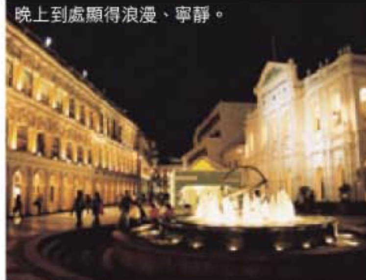
晚上到處顯得浪漫、寧靜。

到澳門旅遊不可能不到此一遊，這裡好比香港的旺角、銅鑼灣，你既可發現種種充滿歐陸風味的建築，又可以親睹一些歷史遺留下來的建築物，那種新舊交替的感覺，非常劇烈。不說不知，這裡白晝和夜晚可以說是截然不同的世界。白天這裡到處人頭湧湧，但到了晚上，又變得一片寧靜浪漫，因此，想認真感受這個地方，便要留意遊覽時間。