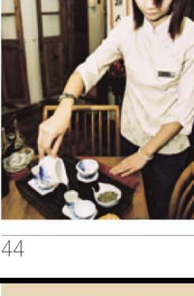
這裡會有專人即席表演茶道。

📍 澳門新馬路390 - 396號 📍 370 533 📍 10:30am - 8:00pm 📍 2, 3, 3A, 4, 5, 6, 7, 8A, 10, 10A, 11, 18, 19, 21, 21A, 26, 26A, 33