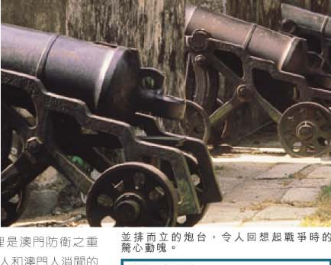
並排而立的炮台，令人回想起戰爭時的驚心動魄。

大炮台區於17世紀初，由耶穌會會士興建。昔日這裡是澳門防衛之重點，今日則變成了遊人和澳門人消閒的好地方。大炮台四周景觀優美，可俯瞰全個澳門景色，若天氣良好，你更可以遠眺新口岸及拱北一帶的風光。