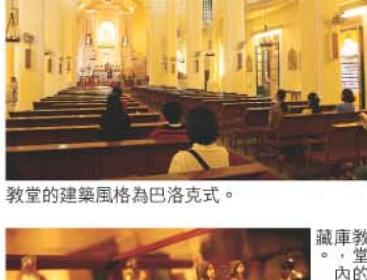
教堂的建築風格為巴洛克式。