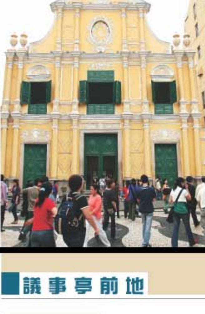
進內參觀。教堂的歐陸情調令不是教徒的遊人都忍不住。

📍 澳門議事亭前地大廣場內 📍 10:00am - 6:00pm 📍 2, 3, 3A, 4, 5, 6, 7, 8A, 10, 10A, 11, 18, 19, 21, 21A, 26, 26A, 33