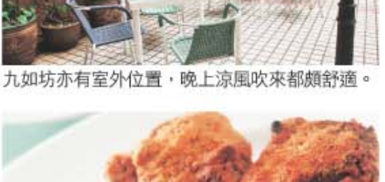
九如坊亦有室外位置，晚上涼風吹來都頗舒適。