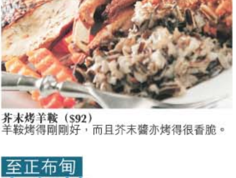
芥末烤羊腩( $92 )，而且芥末醬亦烤得很香脆。