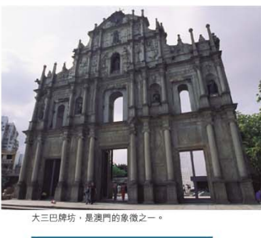
大三巴牌坊，是澳門的象徵之一。

1835年1月26日黃昏，聖保祿教堂失火，一發不可收拾，焚燒了兩個多小時，整幢教堂幾乎付諸一炬，幸好教堂最珍貴的前壁仍能保存屹立，成為今日的大三巴牌坊，期間曾數度修葺，最近一次大規模的維修保養工程於1991年進行。