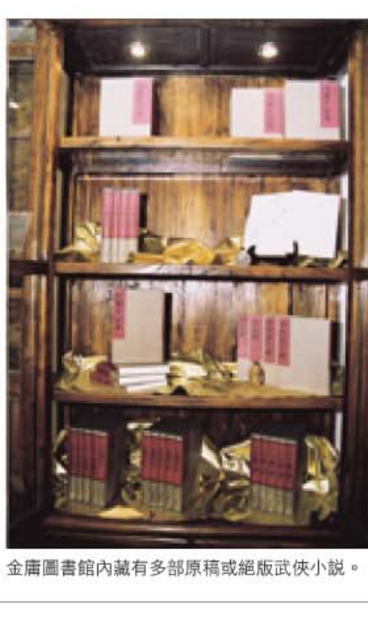
金庸圖書館內藏有多部原稿或絕版武俠小說。