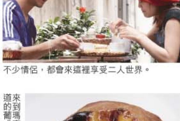
不少情侶，都會來這裡享受二人世界。