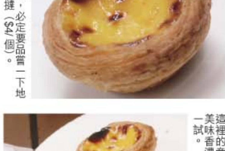
道來的葡式蛋撻，一定要試一下。