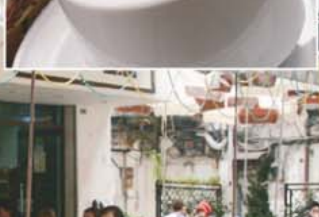
這裡的意式咖啡，香味濃郁，值得一試。